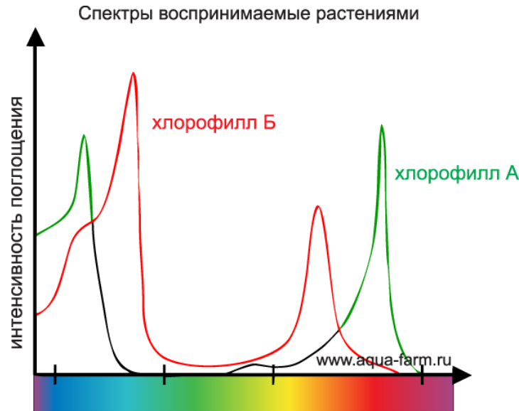
Рис. 1. Части солнечного спектра воспринимаемые растениями [4].

Солнечное излучение, прошедшее через земную атмосферу, имеет спектральное распределение, показанное на рис. 2. [7]. Рентгеновское излучение поглощается в ионосфере азотом, кислородом и др. атмосферными компонентами. Большая часть ультрафиолетового излучения поглощается озоном. На длинах волн более 2,5 мкм, ввиду низкого уровня внеземного излучения, а также сильного поглощения \text{CO}_2 , очень малая часть такого излучения достигает земли. Таким образом, с точки зрения наземного применения солнечной энергии необходимо учитывать только излучение с длинами волн от 0,29 до 2,5 мкм.