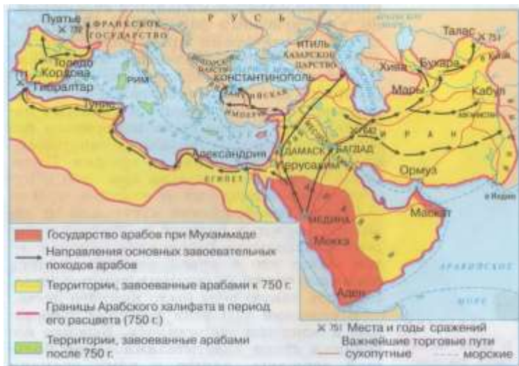
Карта арабских завоеваний Африки, Европы, Ближнего Востока, Кавказа и Средней Азии (7 – 9 века н.э.) (сплошными и прерывистыми чёрными линиями со стрелками показаны направления завоевательных походов)