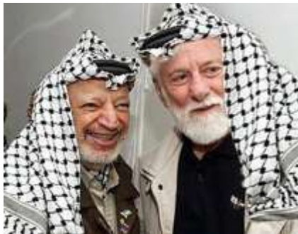
Ясир Арафат и Ури Авнери

Ури Авнери активно призывал к созданию «палестинского» государства со столицей в Иерусалиме, обвинял власти Израиля в «военных преступлениях», говорил, что «готов служить Арафату «живым щитом».