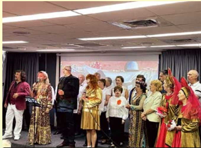
Музыкальный поклон памяти павших воинов и в честь победителей-сибиряков от группы исполнителей концертной программы

Выступления разножанровых исполнителей были яркими иллюстрациями высокого