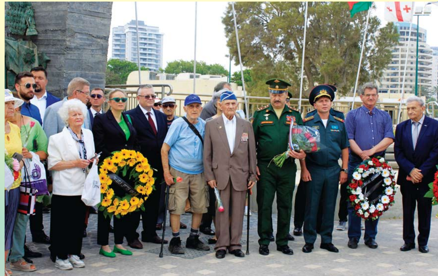
22.06.2022 г. Нетания. «Крылья Памяти». Минута молчания