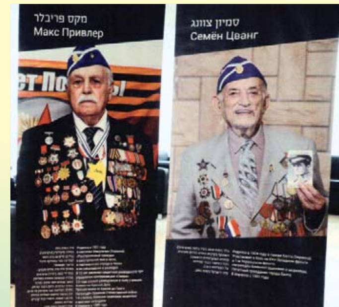
Стенды героев войны. Выставка в кнессете Нет героев – нет стендов

На гостевых трибунах кнессета в этом году немногочисленно. Приглашения и оформление