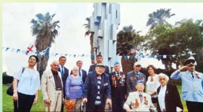
«Свеча памяти». Иерусалим. Митинг. 22.06.2022