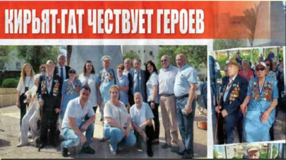
Фрагмент из еженедельника «Мост»