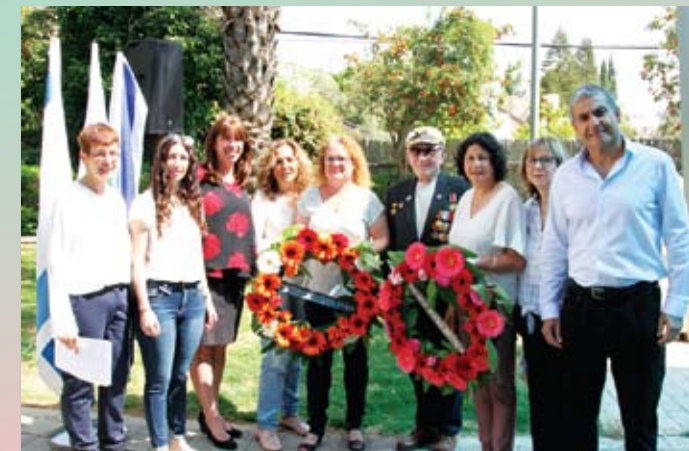
Петах-Тиква и Гиват-Шмуэль – соседи и соратники

На следующий день я поехал в пригород Петах-Тиквы – Гиват-Шмуэль, С этим красивым