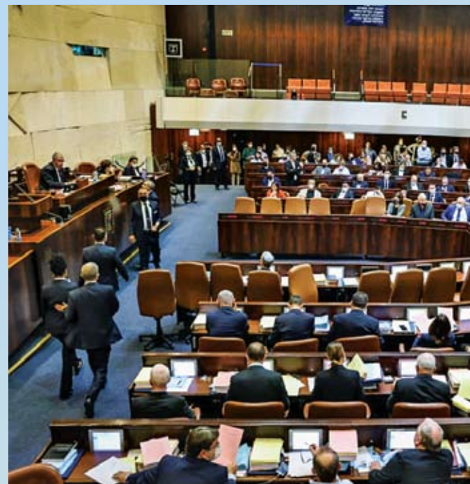
חברי הכנסת שנעדרו בישיבת הכנסת ב-10.05.2022

מחברי הכתבה, אחרי שיכתוב כתבות התקשורת המערבית והאוקראינית (בעיקר, תרגומים) על כוונות של מוסקבה להפגין את הפוטנציאל התוקפני של רוסיה, קישטו (אנו לא יכולים להגיד אחרת) את הטקסט שלהם ע"י תמונתו המרשימה של פוטין עם כרזה בה דיוקן הלוחם תוך מבצע "גדוד אלמוות". תוך רצונם להפחית דיסוננס חזותי בחלק גדול של העמוד, ציינו העיתונאים כי 9 במאי ש"ז לא הפך ליום הניצחון של פוטין. למרות הנבואות שנשמעו מקייב ומארה"ב על רמה גבוהה, רוסיה לא הכריזה מלחמה באוקראינה. נשיא הפדרציה