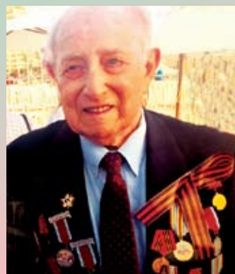
Мартин Раубфогель, 2015 г.

Улица имени советского офицера Мартина Раубфогеля, председателя городского комитета инвалидов войны, после третьего ранения потерявшего руку в бою с нацистами. Только через 3 года после его кончины мэрия выполнила хода-