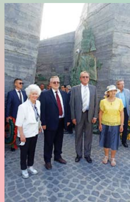
«Крылья Памяти» – 22.06.2022