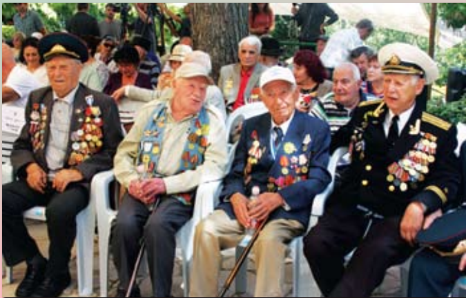
В почетном ряду. Победа-77. Иерусалим

Беэр-Шева – колонной на митинг к пл. Победы, 9:00