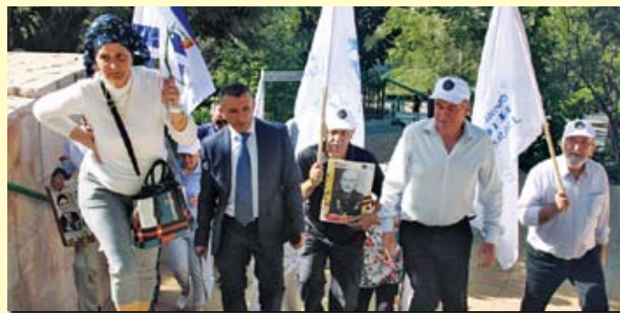
Старт шествия «Бессмертный полк» – гора Герця, от Мемориала в Иерусалиме – по всей стране

В нем приняли участие министр алии и интеграции Пнина Тамано-Шата, министр строи-