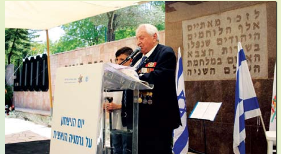
יו"ר ברית הוותיקים אגרינייד אומר על כל הבמות: נחוג את יום הניצחון 9 במאי בישראל לעולם!

ויינרוב וגם בנימין מינדלין (מועמדותו הוגשה 5 פעמים לתואר-כבוד גיבור ברה"מ, אך לא הוענק בתואר הזה).