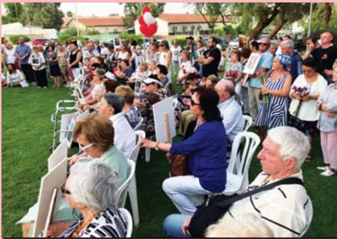
Эйлат. Парк Фрадкин